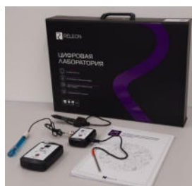
Рис. 1. Цифровая лаборатория

В комплекте цифровых лабораторий содержатся мультидатчики и монодатчики. Мультидатчик по экологии позволяет измерять следующие показатели: водородный показатель водных сред, концентрации нитрат-ионов и хлорид-ионов, электропроводность, влажность, освещённость, температуру окружающей среды, температуру растворов, растворов и твёрдых тел (рис. 2).