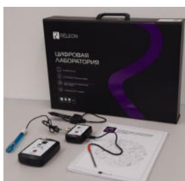
Рис. 1. Цифровая лаборатория

Датчики и дополнительные материалы (переходники, чувствительные элементы, методические материалы, зарядное устройство и др.) комплектуются в коробки-чемоданы.