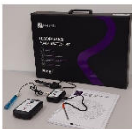
Рис. 1. Цифровая лаборатория

Датчики и дополнительные материалы (переходники, чувствительные элементы, методические материалы, зарядное устройство и др.) комплектуются в коробки-чемоданы.