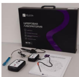
Рис. 1. Цифровая лаборатория

Датчики и дополнительные материалы (переходники, чувствительные элементы, методические материалы, зарядное устройство и др.) комплектуются в коробки-чемоданы.