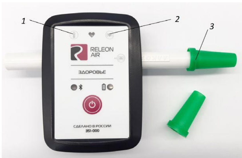
Алгоритм работы с цифровым датчиком