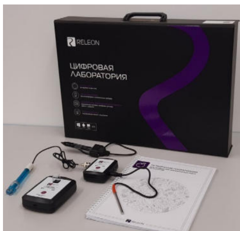
Рис. 1. Цифровая лаборатория

Датчики и дополнительные материалы (переходники, чувствительные элементы, методические материалы, зарядное устройство и др.) комплектуются в коробки-чемоданы.