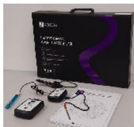
Рис. 1. Цифровая лаборатория

Датчики и дополнительные материалы (переходники, чувствительные элементы, методические материалы, зарядное устройство и др.) комплектуются в коробки-чемоданы.