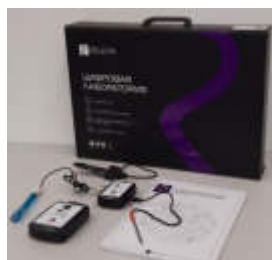
Рис. 1. Цифровая лаборатория

Датчики и дополнительные материалы (переходники, чувствительные элементы, методические материалы, зарядное устройство и др.) комплектуются в коробки-чемоданы.