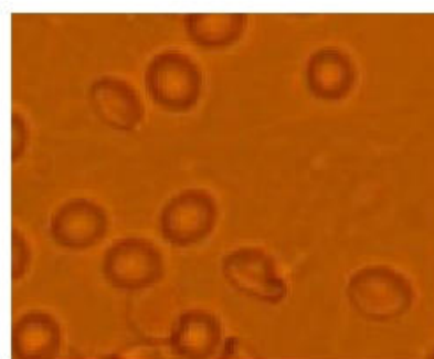
Рис.1. Изотонический р-р Рис. 2. Гипертонический р-р Рис. 3. Гипотонический р-р Влияние среды на структуру эритроцита