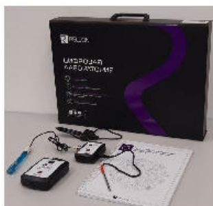
Рис. 1. Цифровая лаборатория

Датчики и дополнительные материалы (переходники, чувствительные элементы, методические материалы, зарядное устройство и др.) комплектуются в коробки-чемоданы.