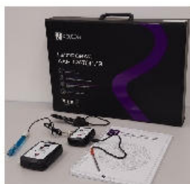
Рис. 1. Цифровая лаборатория

Датчики и дополнительные материалы (переходники, чувствительные элементы, методические материалы, зарядное устройство и др.) комплектуются в коробки-чемоданы.